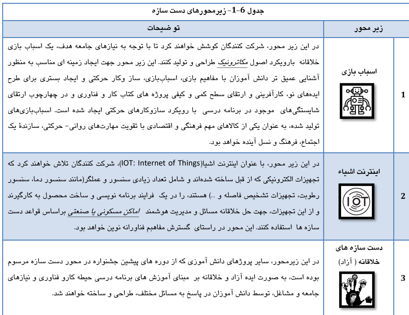
جدول 6-1- زیر محورهای دست سازه

• تذکر: در زیر محور اسباب باز باید از مباتی مکانیک، الکترونیک، برنامه نویسی حداقل از ۲ مورد استفاده شده باشد